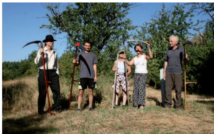
KOSENÍ JE UMĚNÍ. Organizátoři Starodávného kosení nechali účastníky „trápit“ se s kosami dvě hodiny. Pak je pozvali na třešňově a švestkově laděné občerstvení.

velmi poutavě vyprávět o různých historických událostech týkajících se nejbližšího okolí. „Vysvětlil také ten pravý důvod lidového názvu sadu Na Posranci. Ten nesouvisí s nadměrným požitím třešně