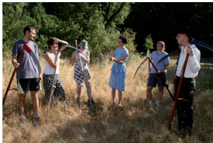
KOSENÍ JE UMĚNÍ. Dnešní zahradníci jsou zvyklí na sekačky a křovinořezy. Jak těžké to měli předkové, se přesvědčili dobrovolníci na Starodávném kosení v sadu na Velkém Kosíři.